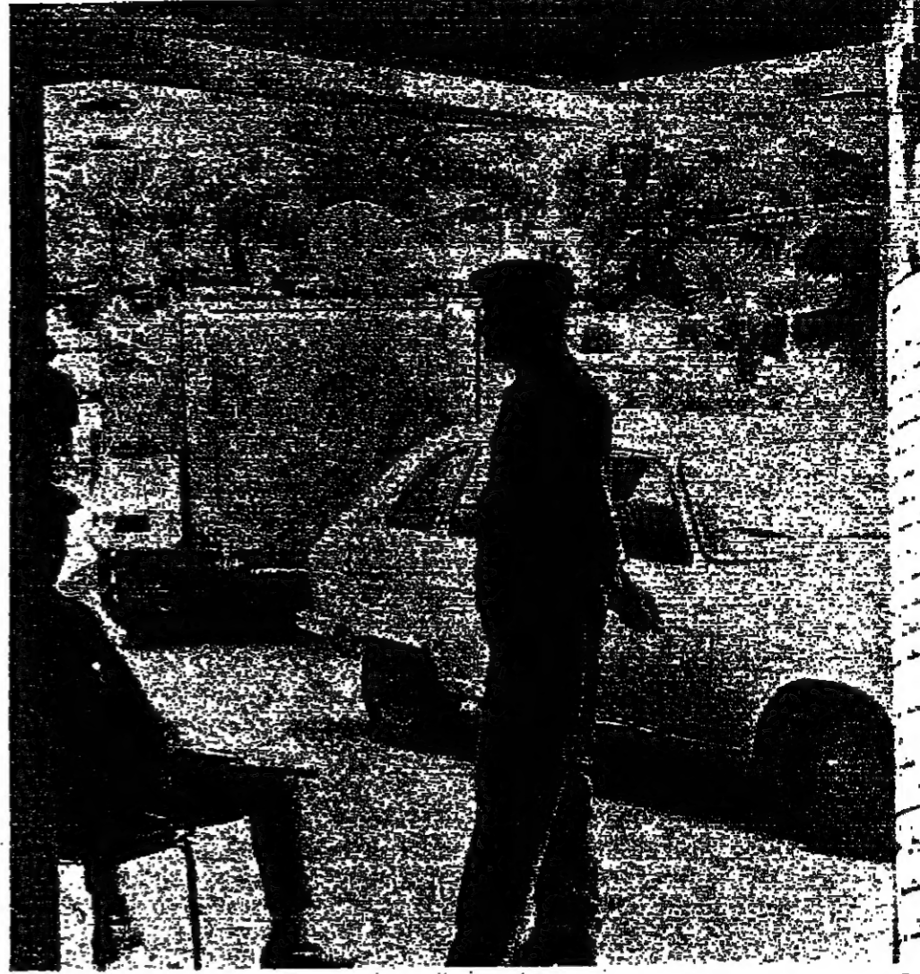
جنديان وملاحة في محطة الصنّاع لاسي